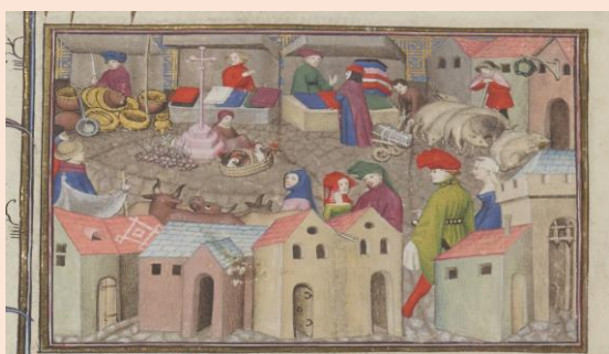
BnF, MS Français 12559, f. 167r

IMS-Paris est un organisme interdisciplinaire et bilingue (français/anglais) dont l'objectif est de favoriser les échanges entre médiévistes français et étrangers. Pour déjà plus d'une décennie, l'IMS aide les médiévistes venant en France pour le travail, les études ou la recherche.